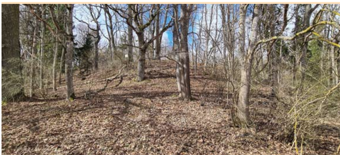
Kurklelių piliakalnis stūkso 230 metrų į vakarus nuo žvyrkelio Katlėriai – Pečiuliai.

Užunvėžių, Kurklių sen., piliakalnis įrengtas aukštumos kyšulyje, 280 m į pietvakarius nuo Užunvėžių mokyklos pastato, kurio vakarinis šlaitas apaugęs spygliuočiais, kiti šlaitai – mišriais medžiais ir krūmais. Aikštelė apvali, 17 m skersmens. Jos pietinėje pusėje supiltas 1 m aukščio 12 m pločio ties pagrindu pylimas, už kurio iškastas 13 m pločio 1,5 m gylis griovys. Už griovio būta trapecinio 20 m ilgio 32 m pločio šiaurinėje dalyje ir 37 m pločio pietinėje dalyje priešpilio, nuo gretimos aukštumos atskirto 10 m pločio iki 1 m gylis griovio. Piliakalnio šlaitai statūs, 18 m aukščio. Piliakalnis labai apardytas ankstesnių arimų metu, priešpilio griovys užlygintas, jo liekanos matyti tik ties šlaitų pradžia. Piliakalnio griovys per vidurį irgi užpiltas į piliakalnį įrengiant kelią, pylimo rytinis kraštas nukastas ar nuslinkęs. Datuojamas II tūkstantmečio pradžia“.