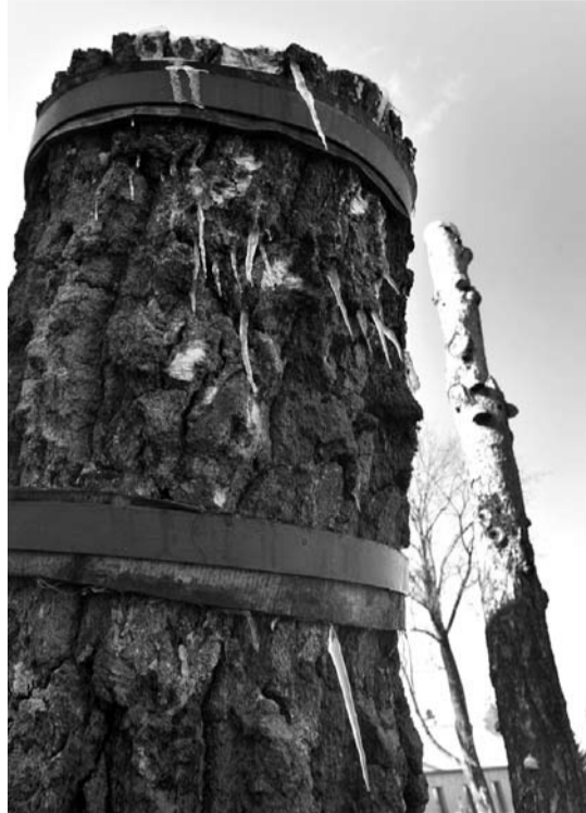
Varvekliais pakibusi sula iš nupjauto beržo rodo, kad stuobrys dar turi gyvybės. Gal atžels?