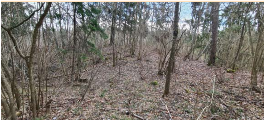
Užunvėžių piliakalnis yra vos 280 metrų į pietvakarius nuo šiuo metu jau apleistos Užunvėžių mokyklos, kurios statybą fundavo Vasario 16- osios akto Signataras Steponas Kairys.