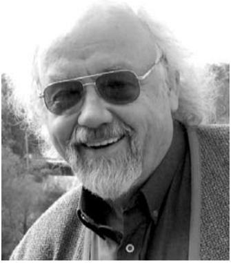
Tėsinys. Pradžia „Anykšta“ Nr. 23, 2022-03-22

Šis tekstas – pasiūlymas anykštėnams drąsiau pasisakyti svarbiomis mūsų krašto, istorijos, kultūros temomis, analizuoti jas. Kad, įgyvendindami bet kokius projektus, nenueitume vienos skubiai „nuleistos“ nuomonės, viešųjų pirkimų pamėgto „pigiausio varianto“ keliu.